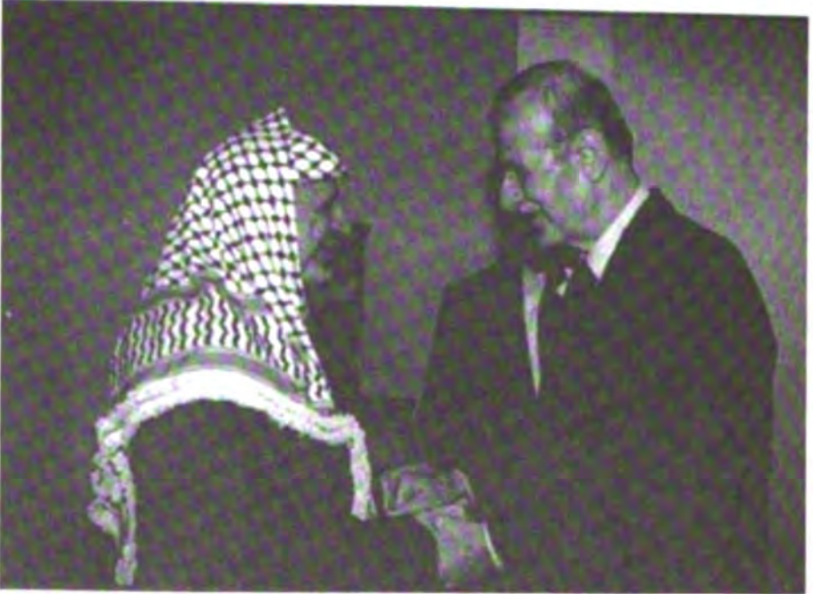
مع الرئيس السوري الراحل حافظ الأسد